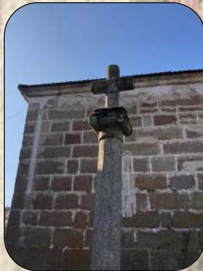
Barrio de A Cruz

La riqueza y fertilidad de los terrenos, en relación con la producción del vino, provoca el asentamiento de familias con poder económico que construyen edificaciones de tipo señorial que todavía hoy se conservan.